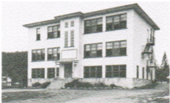
École construite en 1950

Dès la fin de l'année scolaire en 1950 les travaux de construction commencèrent. En février 1951 , les religieuses et les élèves entrent dans le nouvel édifice qui tient lieu de couvent et d'école. En 1952 , on commence à parler d'agrandissement, car on compte 61 élèves. Ce sera fait en 1959 alors qu'on ajoutera deux classes .